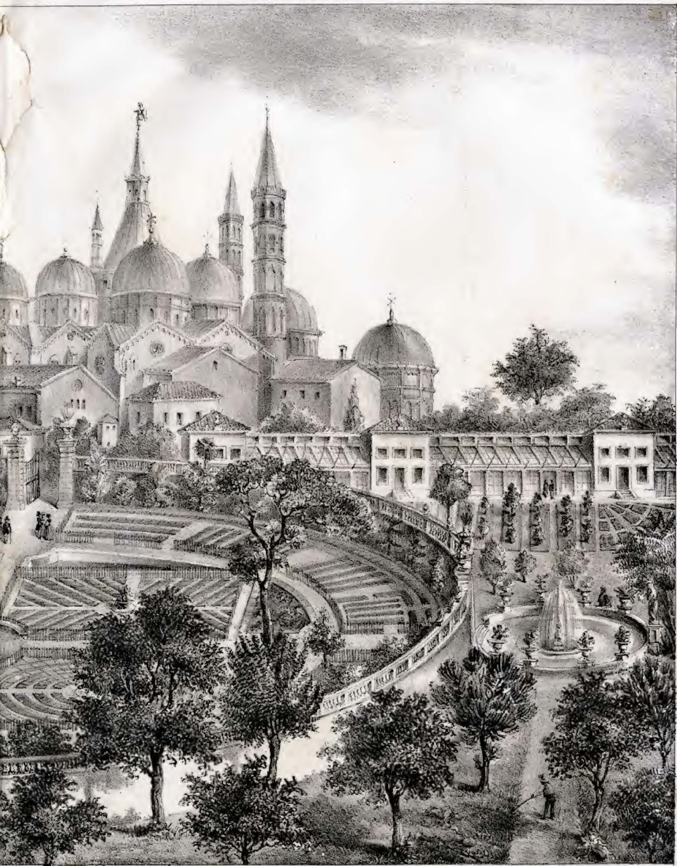
Giardini della Certosa di Padova